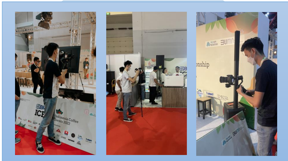
Gambar 3.3 Shooting Liputan Khusus Event ICE 2022

video yang dibuat akan diunggah di Instagram reels milik MerahPutih.com setiap harinya.