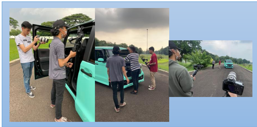
Gambar 3.4 Shooting review kendaraan KabarOto