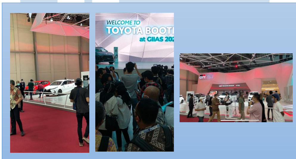
Gambar 3.3 Shooting Liputan GIIAS 2022

Penulis bersama tim membawa equipment shooting dari kantor menuju GIIAS. Penulis menggunakan smartphone sebagai backup dari kamera yang tim gunakan pada saat pembukaan GIIAS. Backup menggunakan smartphone menjadi pilihan tim untuk mengamankan hasil liputan yang penting. Penulis bersama tim melakukan review mobil menggunakan 2 kamera, 1 stabilizer , 1 monopod dan wireless microphone . KabarOto melakukan review beberapa mobil Toyota di event GIIAS secara singkat, dan menjelaskan tema yang diangkat dari event GIIAS “ The Future is Bright ”. Tema tersebut menunjukkan masa depan industri otomotif yang cerah.