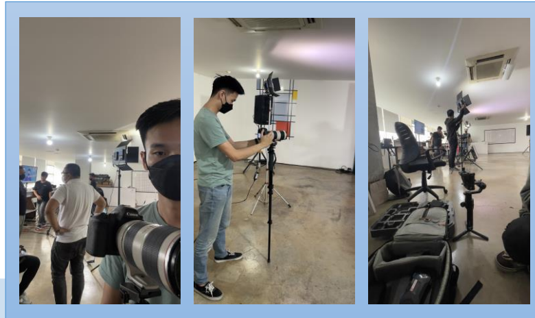
Gambar 3.3 Shooting Liputan Press Conference Aksi Scai