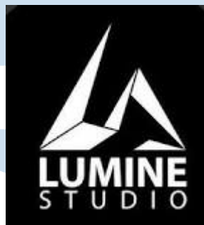
Gambar 2.1. Logo Lumine Studio