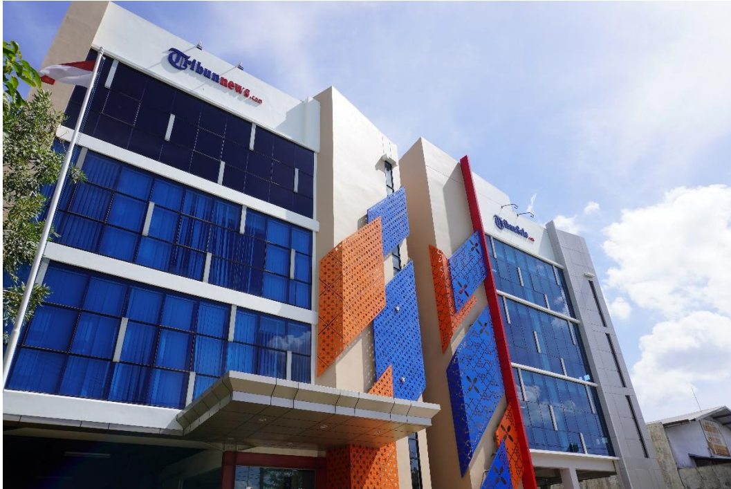
Gambar 2. 3 Tribun Solo

Tribunnews.com menghadirkan beberapa rubrikasi yang menarik dan juga rubrikasi yang dikhususkan bagi jurnalis-jurnalis warga dalam mempublikasikan aktivitas jurnalistiknya, yaitu Tribuners. Dengan bantuan rubrikasi tersebut, diharapkan masyarakat dapat berpartisipasi dalam pembuatan berita dan ikut menyumbangkan ide atau gagasan yang menarik melalui pengalaman yang empiris. Rubrik selengkapnya di Tribunnews.com adalah sebagai berikut: