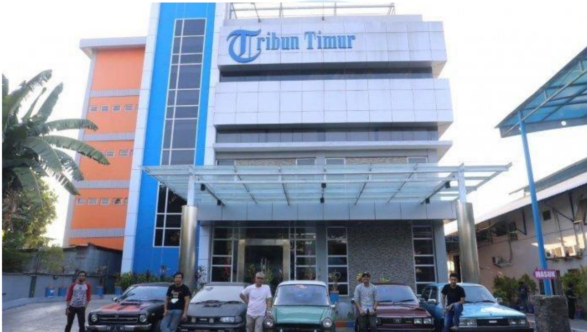
Gambar 2. 2 Tribun Makassar

provinsi melalui media online yang terus berkembang, dan media cetak di berbagai daerah, serta komunitas online Tribunners di seluruh Indonesia.