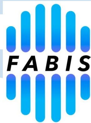
Gambar 2. 1

Fabis Picture adalah rumah produksi yang berada dibawah naungan PT. Bumina Sora Pratama. Fabis Picture dibentuk oleh Faisal Lubis, Wiryantoel, Oscar Sagita dan Garin Nugroho pada tahun 2022. Berlokasi di Jl. Darmawangsa X No. 86, RT 007 RW 008. Fabis Picture dibangun khusus untuk mengarang film Melodrama . Film musikal Melodrama ini merupakan impian lama dari Faisal Lubis dan Garin Nugroho ketika mereka bekerja sama di industri perfilman Indonesia. Terbentuknya Fabis Picture ini adalah hasil dari keputusan mereka saat sepakat untuk memproduksi film Melodrama .