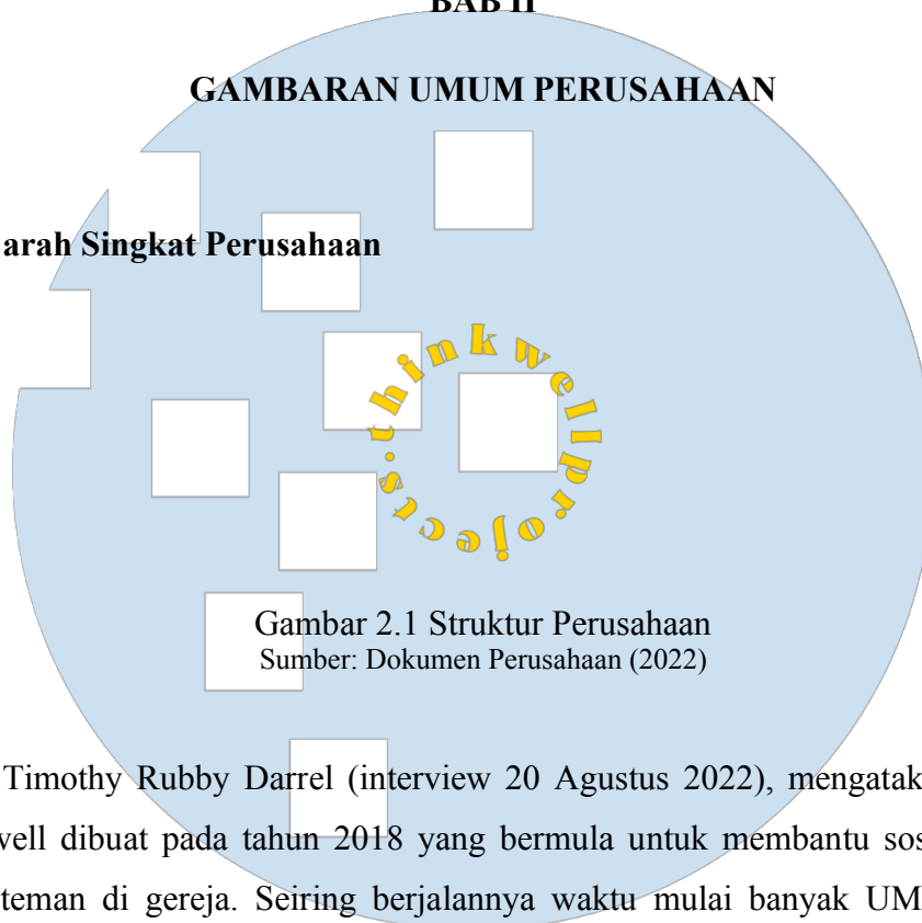
Gambar 2.1 Struktur Perusahaan

Timothy Rubby Darrel (interview 20 Agustus 2022), mengatakan bahwa Thinkwell dibuat pada tahun 2018 yang bermula untuk membantu sosial media teman-teman di gereja. Seiring berjalannya waktu mulai banyak UMKM yang melirik Thinkwell Projects ini. Pada awalnya Thinkwell Projects hanya menyediakan desain untuk sosial media saja, namun sekarang sudah mulai berkembang ke photography , videography dan sampai sekarang menjadi creative digital agency .