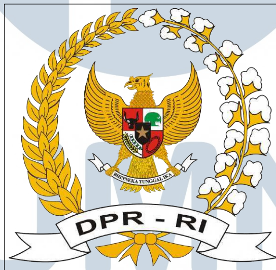
Gambar 2.1. Logo Sekretariat Jenderal Dewan Perwakilan Rakyat Republik Indonesia

Gambar 2.1 menunjukkan logo dari Sekretariat Jenderal Dewan Perwakilan Rakyat Republik Indonesia. Menurut UU Nomor 17 tahun 2014 tentang MPR, DPR, DPD, dan DPRD, Sekretariat Jenderal DPR RI merupakan sistem pendukung DPR. Sebelum Pustekinfo ada, tugas, dan fungsi yang berkaitan dengan teknologi informasi dilaksanakan oleh Bidang Data dan Sarana Teknologi Informasi (BDTI) yang merupakan salah satu bagian dari Pusat Pengkajian Pengolahan Data dan Informasi (P3DI). BDTI mempunyai tugas melaksanakan pengolahan data dan informasi, pemeliharaan dan pengembangan sistem jaringan komputer, dan sistem layanan pengadaan barang atau jasa pemerintah secara elektronik.