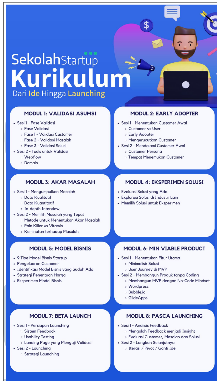
Gambar 2.2. Kurikulum SekolahStartup