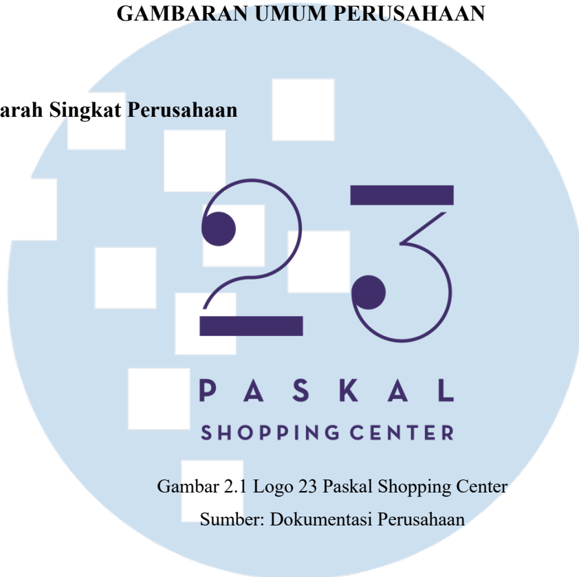
Gambar 2.1 Logo 23 Paskal Shopping Center