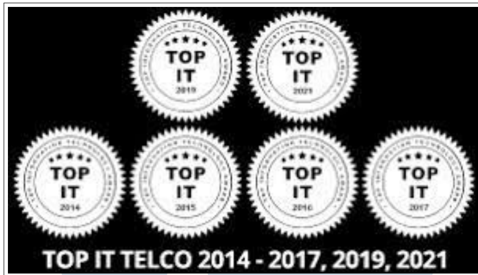
Gambar 2.5. Penghargaan DataOn