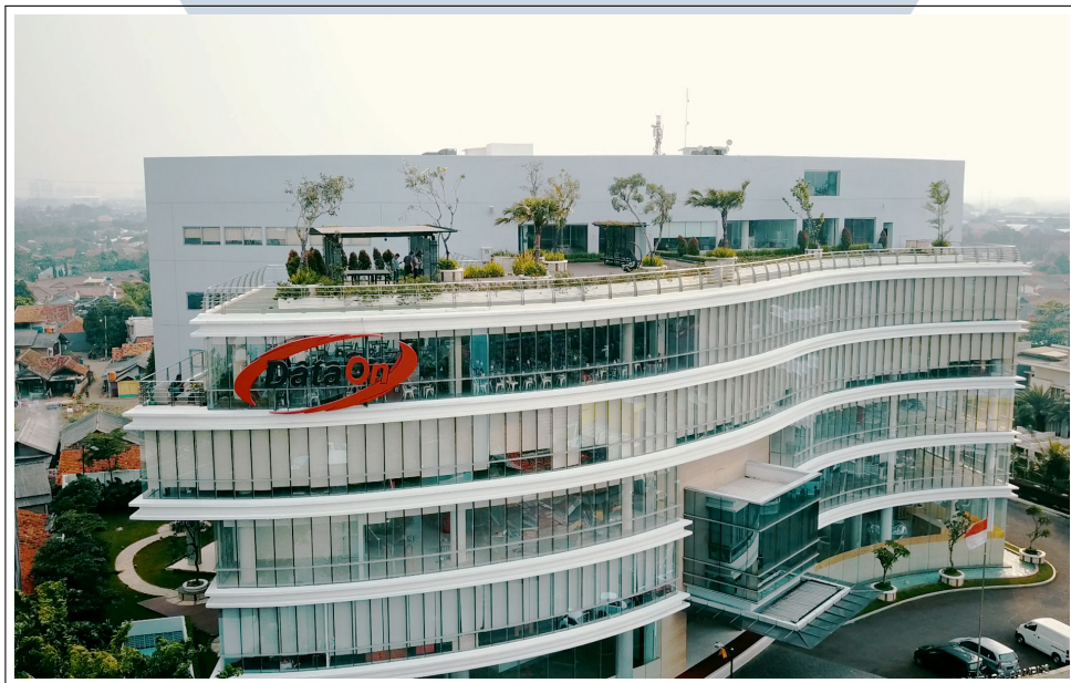
Gambar 2.1. Gedung kantor DataOn