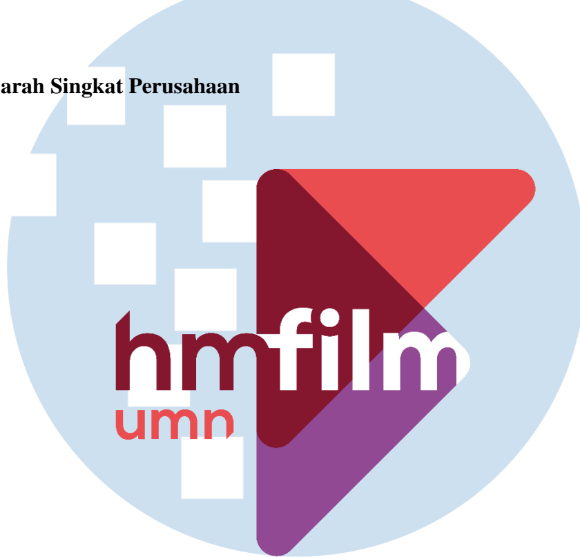
Gambar 2.1 Logo Program Studi Film

Menjelaskan secara singkat sejarah instansi atau perusahaan tempat kerja magang. Program Studi Film UMN merupakan salah satu program studi unggulan yang didirikan pada tanggal 9 Februari 2016 dan berada di bawah naungan fakultas seni UMN. Sesuai dengan namanya, program studi ini berfokus dalam mendidik mahasiswa untuk menjadi seorang pekerja kreatif yang mampu menciptakan medium film ( live action ) serta medium animasi.