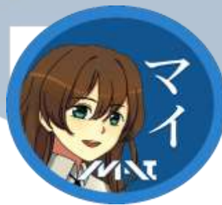
Gambar 2.1. Logo Meme Anime Indonesia

Pada awalnya sebelum Area Media dibuat, ada fanpage bernama Area Anime besutan dari Meme Anime Indonesia (MAI) yang merupakan official account . Sekitar tahun 2016, beberapa official account terkena banned dengan alasan yang tidak jelas dan hilang. Salah satu admin Olivia Della berinisiatif untuk membuat Meme Anime Indonesia cabang Instagram , semua berjalan dengan lancar hingga 2 minggu namun akun official kembali lagi dan mereka lebih banyak mengepost di official account dan Instagram terbengkalai.