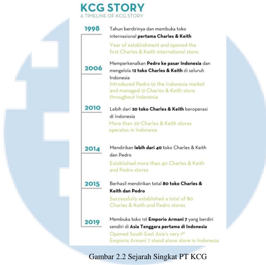
Gambar 2.2 Sejarah Singkat PT KCG

PT Kurnia Ciptamoda Gemilang telah berdiri sejak 1998 sebagai perusahaan ritel Indonesia yang menaungi brand fashion asal Singapura, yaitu Charles & Keith, Pedro, dan Emporio Armani 7. Timeline perjalanan perusahaan dapat dilihat pada gambar 2.2 di atas. Pada tahun 1998, PT KCG mulai berdiri dengan membuka toko Charles & Keith pertama di Indonesia dan di dunia internasional. Perjalanan PT KCG berlanjut di tahun 2006, dimana PT KCG pertama kali memperkenalkan brand fashion Pedro ke dalam pasar Indonesia. Pada tahun yang sama, PT KCG telah memiliki 12 toko Charles & Keith yang tersebar di seluruh Indonesia. Proses perkembangan brand Charles & Keith terus meningkat pada tahun-tahun selanjutnya. Pada tahun 2010, Charles & Keith berkembang menjadi 20 toko di Indonesia dan terus meningkat hingga tahun 2018 PT KCG resmi memiliki 80 toko Charles & Keith serta Pedro yang tersebar di pusat perbelanjaan seluruh Indonesia. PT