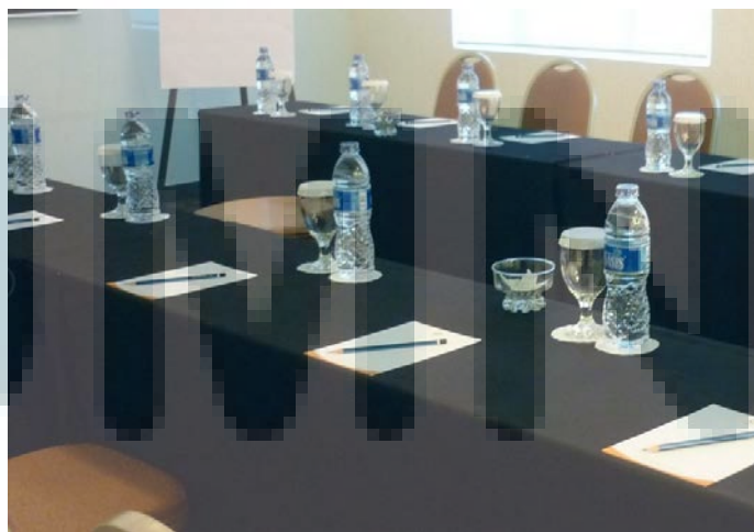
Gambar 3.7. Preview Meeting Room Oria Hotel