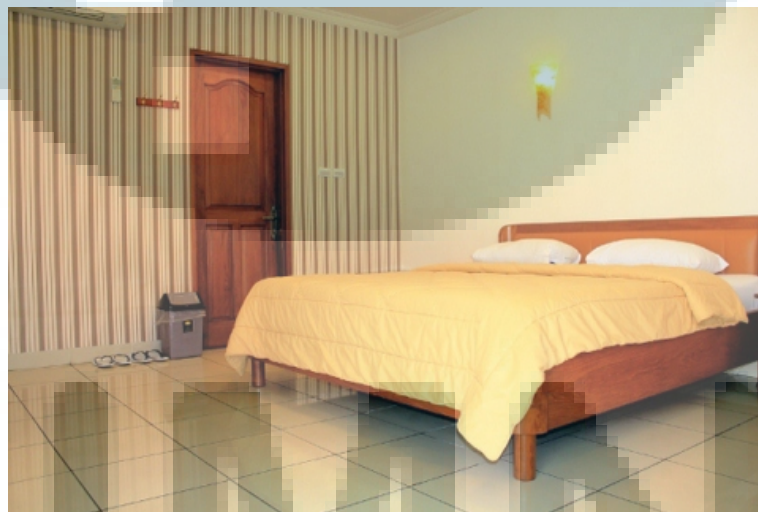
Gambar 3.2. Preview Kamar Tipe Superior (Sumber: http://678hotel.co.id )

dididik dan dilatih secara tegas dan disiplin baik secara keterampilan, moral, manner , maupun mental. Upaya ini tidak sia-sia, hal ini terbukti atas dibangunnya cabang kedua Hotel 678 di daerah Cawang, yang membuktikan berkembangnya usaha perhotelan dari PT. 678 Jaya Sentosa. Hotel ini telah melewati masa penilaian dan evaluasi dari Direktorat Jendral Pariwisata dalam pengklasifikasiannya ke dalam hotel berbintang tiga baik dari jumlah kamar, fasilitas, maupun pelayanan yang tersedia, hal ini dibuktikan dengan sertifikat resmi sesuai dengan surat keputusan menteri perhubungan No.PM.10/P.V.301/pht/77 tanggal 22 Desember 1977 tentang peraturan industri perhotelan.