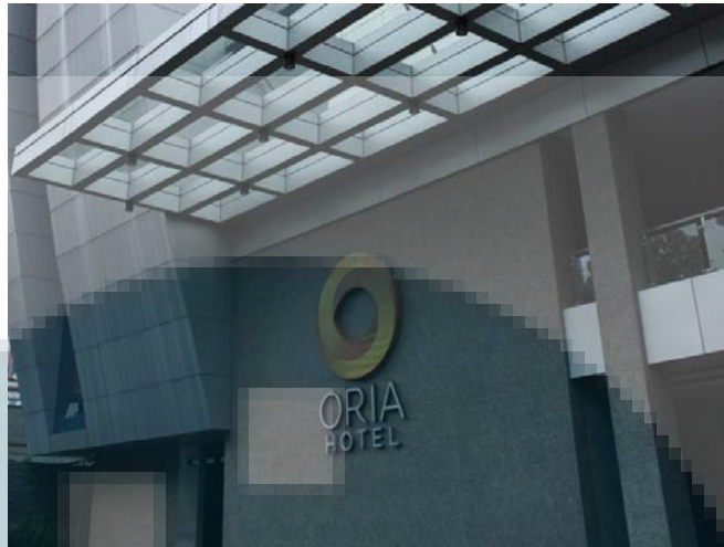
Gambar 3.5. Oria Hotel