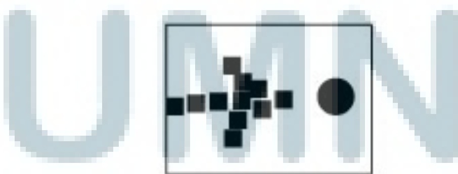
Gambar 2.2 Emphasis

Informasi yang disampaikan kepada audiens harus ditonjolkan secara mencolok melalui visual elemen yang kuat, penekanan dilakukan dengan menggunakan warna yang mencolok, ukuran foto/ilustrasi yang besar, menggunakan font dengan ukuran besar dan dibuat berbeda dengan elemen lain. Dalam desain komunikasi visual dikenal istilah focal point , yaitu penonjolan salah satu elemen visual dengan tujuan untuk menarik perhatian.