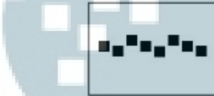
Gambar 2.3 Rhythm

Irama adalah pola layout yang dibuat dengan cara menyusun elemen-elemen visual secara berulang-ulang. Irama visual dalam desain grafis dapat berupa repetisi dan variasi, repetisi adalah irama yang dibuat dengan penyusunan elemen berulang kali secara konsisten. Variasi adalah perulangan elemen visual disertai perubahan bentuk, ukuran, atau posisi.