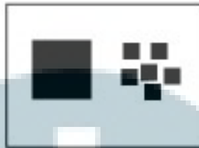
Gambar 2.1 Keseimbangan

( http://payload49.cargocollective.com/1/0/24517/3281780/principlesDesign.jpg ,2011)