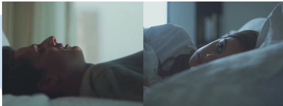
Gambar 3.3 Referensi Video Musik We Don't Talk Anymore

Dari konsep utama tersebut, penulis dan tim penulis menggunakan semiotika telepon kaleng dan set lokasi kamar mereka berdua yang memiliki jendela yang bersebelahan untuk menggambarkan koneksi di antara mereka berdua yang dekat. Namun, saat mereka dipisahkan oleh kesibukan satu sama lain, terdapat teknik editing split screen yang digunakan untuk memisahkan jarak antara kedua karakter. Terdapat 2 (dua) frame yang berbeda menggunakan teknik editing split screen . Sedangkan saat mereka saling berhubungan, frame menjadi 1 (satu) untuk menandakan kesatuan hubungan mereka berdua. Kami menggunakan video musik Charlie Puth – We Don't Talk Anymore sebagai referensi teknik editing split screen tersebut.