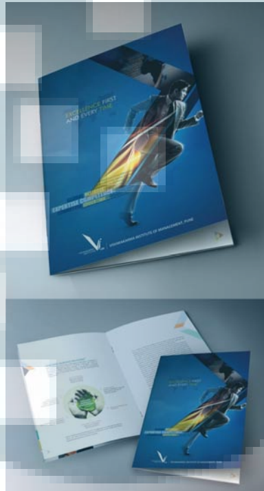
Gambar 2.2 Contoh ilustrasi teknik gabungan ( http://www.hongkiat.com/blog/handpicked-printed-brochures/ )

Bentuk komunikasi dengan struktur visual yang dipadukan antara teknik fotografi dan ilustrasi manual (Pujiriyanto, 2005 ; 41)