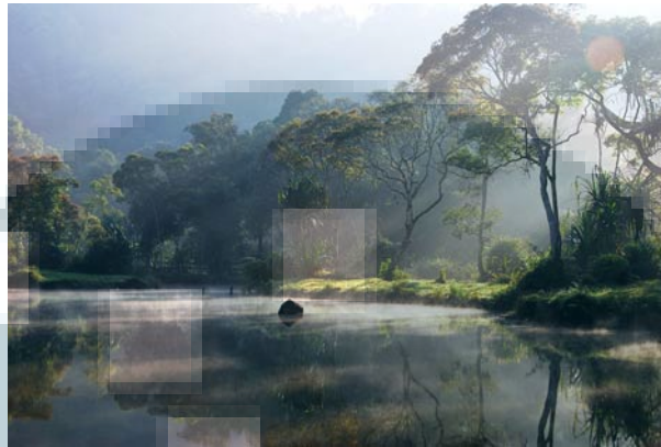
Gambar 2.1 contoh karya fotografi (Manajemen Situgunung Park, 2013)