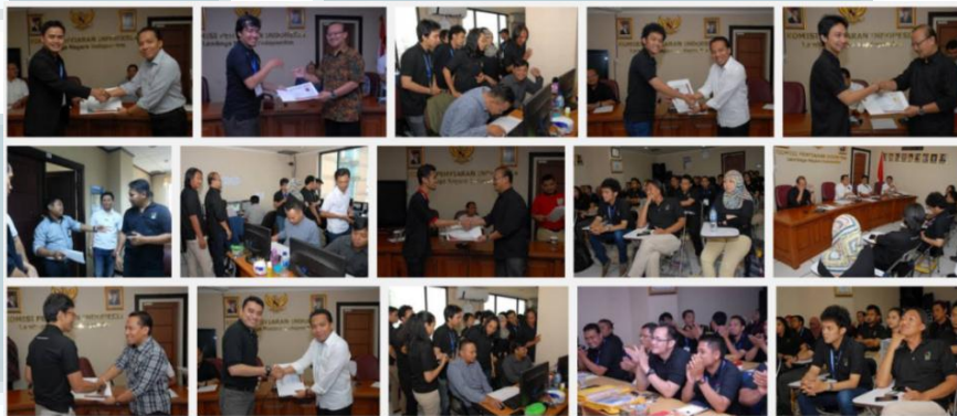
Gambar 1.2 Suasana Sekolah P3SPS

diisi dengan paparan materi, sedangkan hari terakhir peserta akan diberikan ujian dan diskusi yang akan dipresentasikan untuk dibahas bersama. Tidak menutup kemungkinan pula Sekolah P3SPS dapat dilaksanakan di daerah lain, sesuai dengan kebutuhan dan agenda kerja KPI.