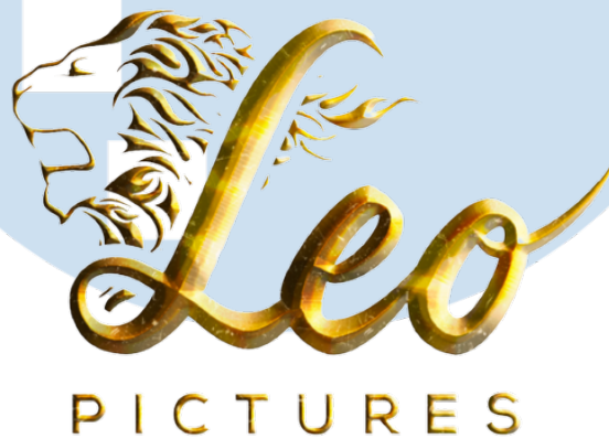
Gambar 2.1 Logo Leo Pictures

PT. Agung Lion Sinema dengan nama perusahaan Leo Pictures adalah rumah produksi yang bergerak di bidang produksi film layar lebar dan film berseri untuk platform Over the Top (OTT) . Leo Pictures sedang dalam tahap untuk merilis film layar lebar pertama yang berjudul “Sosok Ketiga”. Film ini akan tayang pada bulan juni 2023.