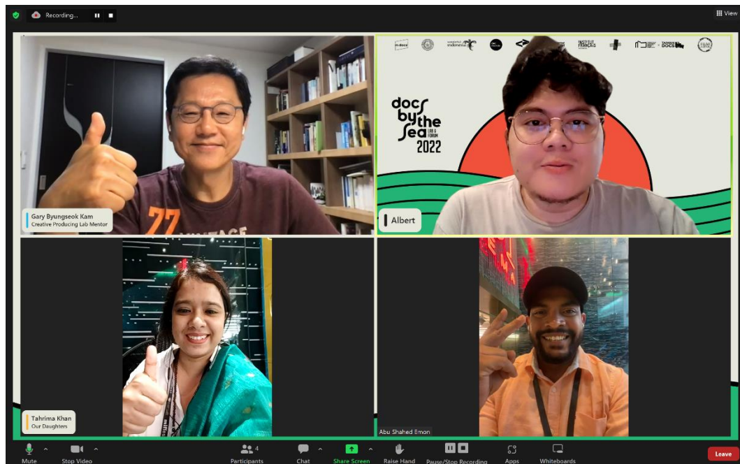
Gambar 4.8 Proses mentoring tim Our Daughter

Gambar di atas adalah contoh proses yang dilakukan oleh penulis untuk memastikan bahwa proses pendampingan berjalan dengan baik dan lancar. Pada pelaksanaannya, jarang sekali terjadi kendala. Namun, penulis tetap berjaga di ruang pertemuan dan mengindikasikan kepada seluruh peserta di dalam ruangan tersebut bahwa penulis ada untuk menjadi fasilitator ketika ada hal-hal yang dibutuhkan.