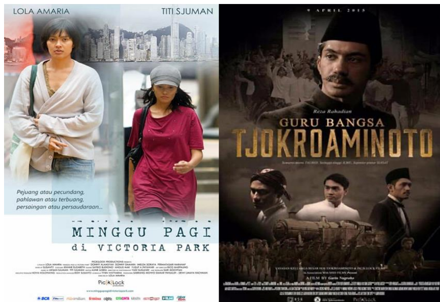
Gambar 2.1 dan 2.2 Minggu Pagi di Victoria Park dan Guru Bangsa Tjokroaminoto

Sejak tahun 2021, Pic[k]Lock Films juga memproduksi serial dokumenter yang berjudul “Maestro” dan “Gue Jakarta” yang tayang di Usee TV Channel, dokumenter “The Quest” yang bekerjasama dengan Kemendikburistek RI, dan dokumenter “Bergerak Bersama Pandemi” yang bekerjasama dengan Kemenkoperekonomian RI. Saat ini Pic[k]Lock Films sedang mengembangkan beberapa film dan serial dan sedang dalam proses kerjasama dengan beberapa platform OTT lingkup nasional dan internasional.