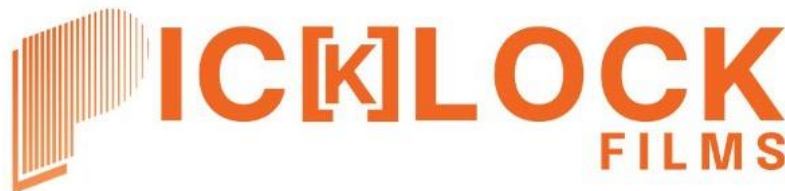
Gambar 2.4 Logo Pic[k]Lock Films