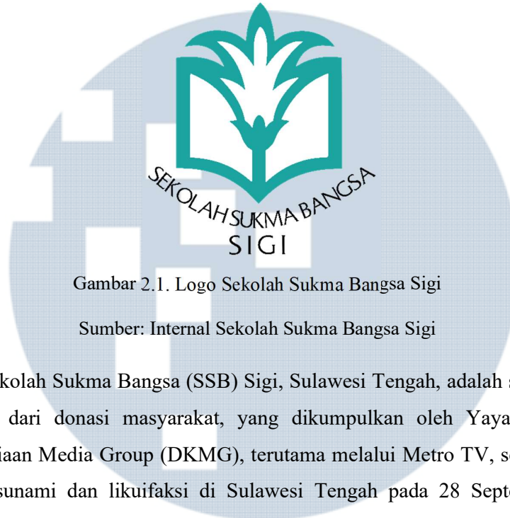
Gambar 2.1. Logo Sekolah Sukma Bangsa Sigi