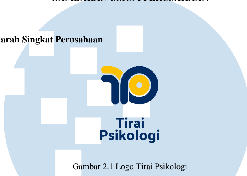
Gambar 2.1 Logo Tirai Psikologi