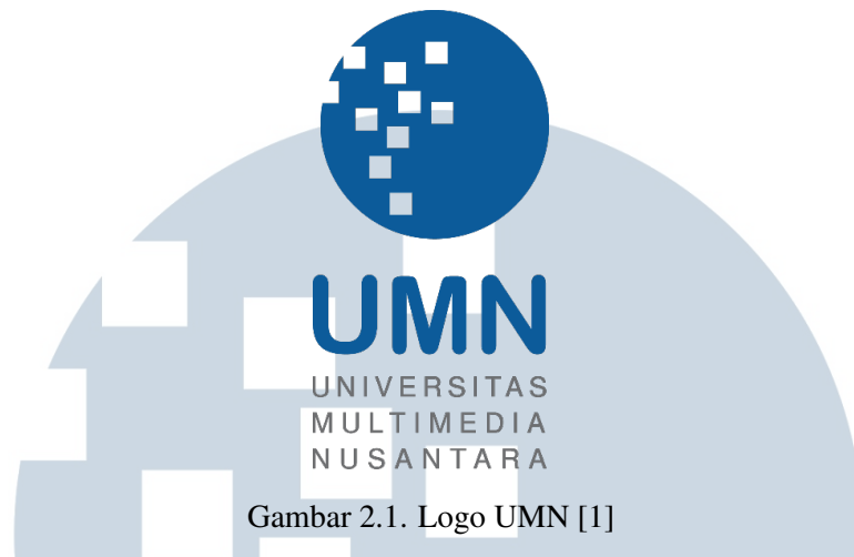
Gambar 2.1. Logo UMN [1]