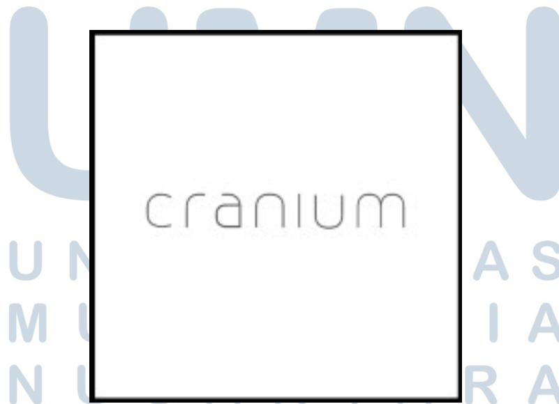
Gambar 2.1. Logo PT Cranium Royal Aditama