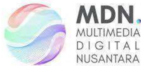
Gambar 2.3 Logo PT. Multimedia Digital Nusantara

UMN Consulting merupakan layanan riset konsultasi yang melakukan penelitian strategis dan analisis data yang berguna untuk mencari solusi untuk memecahkan masalah terkait dengan peluang bisnis, environmental , dan human well-being . Sehingga merek dan peluang bisnis yang dikonsultasikan dengan UMN Consulting dapat menjadi kuat dan terorganisir dengan baik. Sedangkan, UMN Pictures merupakan studio produksi kreatif dan multimedia yang berfokus pada penciptaan dan pengembangan Intellectual Properties (IP) dan layanan multimedia kreatif, seperti game production , animasi, dan interaktif digital. Gambar 2.4 merupakan logo UMN Consulting dan gambar 2.5 merupakan logo UMN pictures .