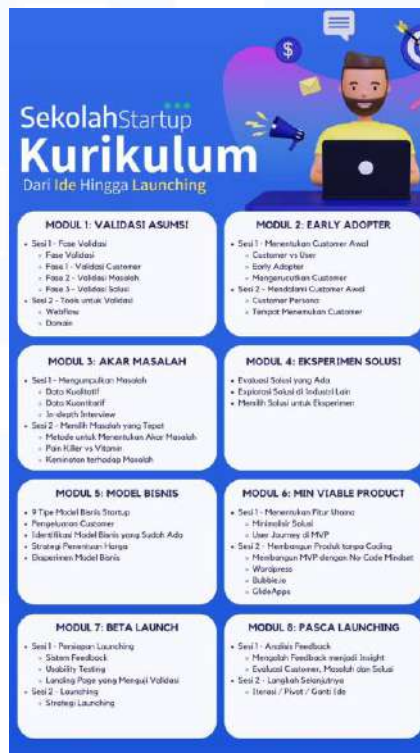
Gambar 2.2 Kurikulum Online Course SekolahStartup

informatika, beliau belajar secara mandiri dan bertekad untuk membantu para startup founder pemula untuk dapat mengembangkan bisnisnya secara digital. Gambar 2.1 merupakan logo PT. Solusi SSI dan gambar 2.2 merupakan tampilan kurikulum online course SekolahStartup.