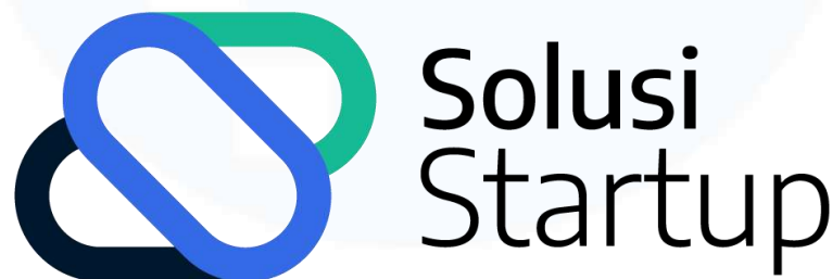
Gambar 2.1 Logo PT. Solusi Startup Indonesia

Proyek magang 2.0 yang dilakukan Universitas Multimedia Nusantara tidak hanya melibatkan satu mitra tetapi dua mitra perusahaan, yaitu PT. Solusi Startup Indonesia dan PT. Multimedia Digital Nusantara. Dalam proyek magang 2.0, berfokus pada perancangan dan pembangunan platform website merdeka 2.0 agar dapat digunakan sebagai sarana penunjang untuk proses pembelajaran oleh seluruh anggota Universitas Multimedia Nusantara.