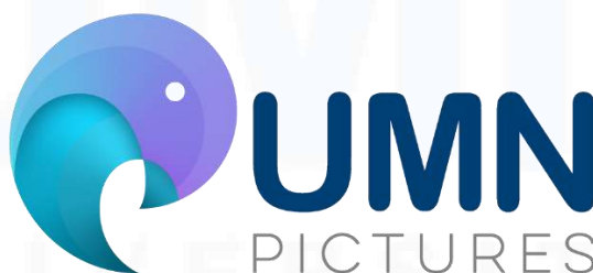
Gambar 2.5 Logo UMN Pictures