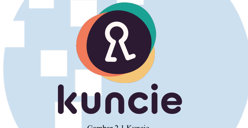
Gambar 2.1 Kuncie

Kuncie merupakan platform pembelajaran bisnis online dan mentoring pengembangan keterampilan kerja bagi talenta-talenda di Indonesia dan diajarkan langsung oleh praktisi dan para ahli di bidangnya. Kuncie sebagai platform edukasi terus memperluas jangkauannya dan terus meningkatkan layanannya melalui kursus online , video pembelajaran, live webinar serta mentoring dengan topik Bisnis, Marketing, Development, Keuangan, Photography, Design dan berbagai topik lainnya. PT Kuncie Pintar Nusantara diakuisisi oleh anak perusahaan Telkomsel yaitu INDICO (Indonesia Digital Ecosystem). Kuncie diluncurkan pertama kali pada Juli 2021 di platform Google Play dan dengan waktu yang cukup singkat Kuncie menduduki peringkat pertama aplikasi pembelajaran online di Google Play Store Indonesia dan meraih penghargaan “Best Personal Growth” dalam ajang Google Play Awards 2021. Saat ini Kuncie sudah membantu lebih dari 1 juta pengguna untuk meningkatkan skill dan belajar bisnis online.