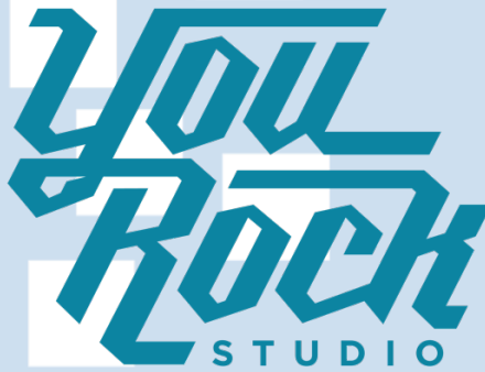
Gambar 2. 1 Logo YouRock Studio