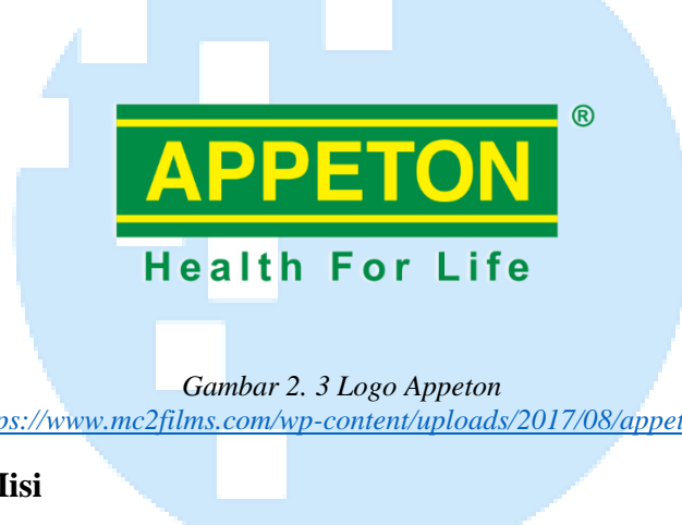
Gambar 2. 3 Logo Appeton