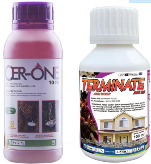
Gambar 2. 6 Contoh Produk ZPT PT Sinar General Industries