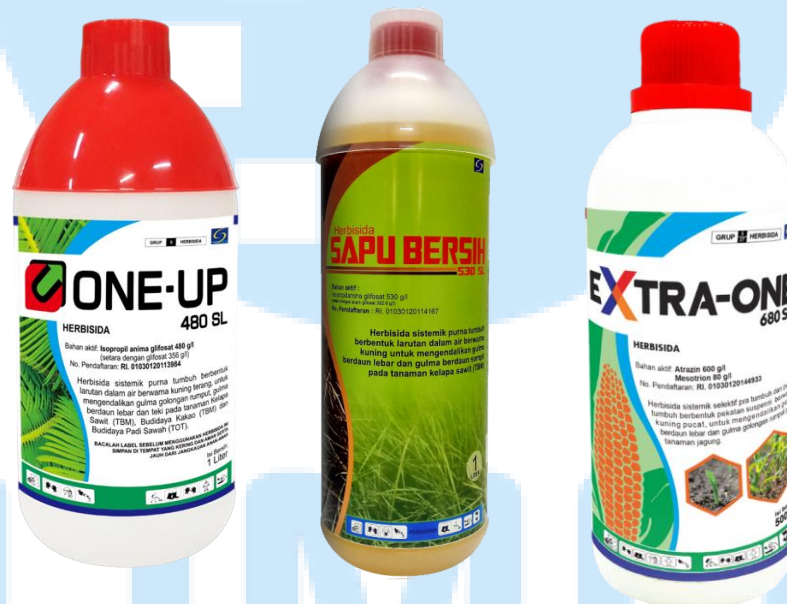
Gambar 2. 4 Produk Insektisida PT Sinar General Industries