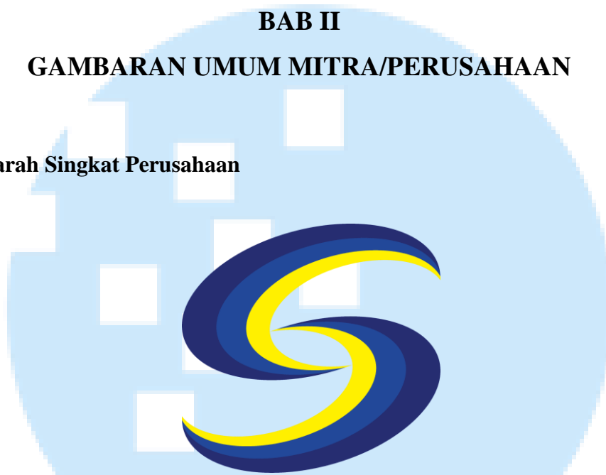
Gambar 2. 1 Logo PT Sinar General Industries