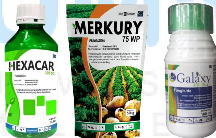
Gambar 2. 2 Contoh Produk Fungisida PT Sinar General Industries