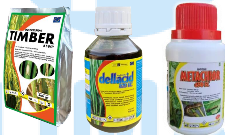
Gambar 2. 3 Contoh Produk Insektisida PT Sinar General Industries