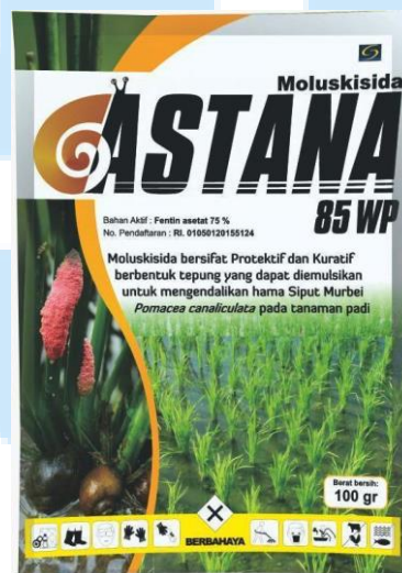
Gambar 2. 5 Contoh Produk Moluskisida PT Sinar General Industries