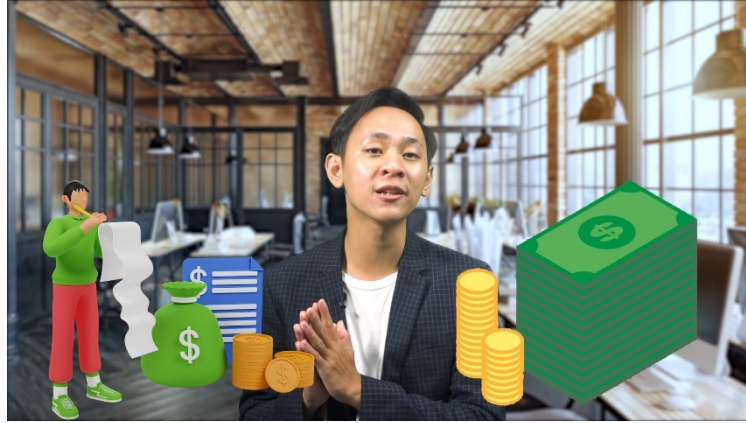
Gambar 3.2 Hasil Video Insurance for GenZ

produksi. Penulis mengerjakan project ini dari tanggal 18 Maret 2023 sampai dengan 29 Maret 2023.