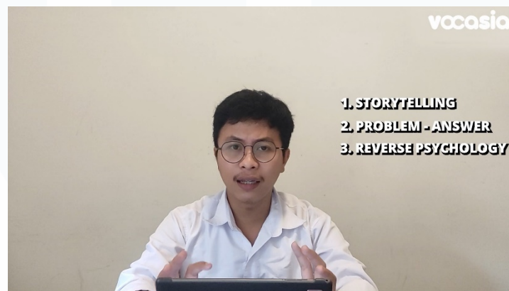
Gambar 3.3 Hasil Video Tiktok Mastery

Tiktok Mastery adalah project kursus kedua yang penulis kerjakan. Penulis bertugas sebagai video editor dan penanggung jawab project ini bernama Fujiana selaku produser. Tiktok Mastery merupakan kursus yang mengajarkan bagaimana cara mendapatkan penghasilan dari Tiktok. Instruktur dari kursus ini bernama Dicky Idrianto. Penulis juga tidak ikut pada produksi project ini dan hanya terlibat saat editing . Project ini berlangsung dari tanggal 3 April 2023 sampai dengan 9 Mei 2023.