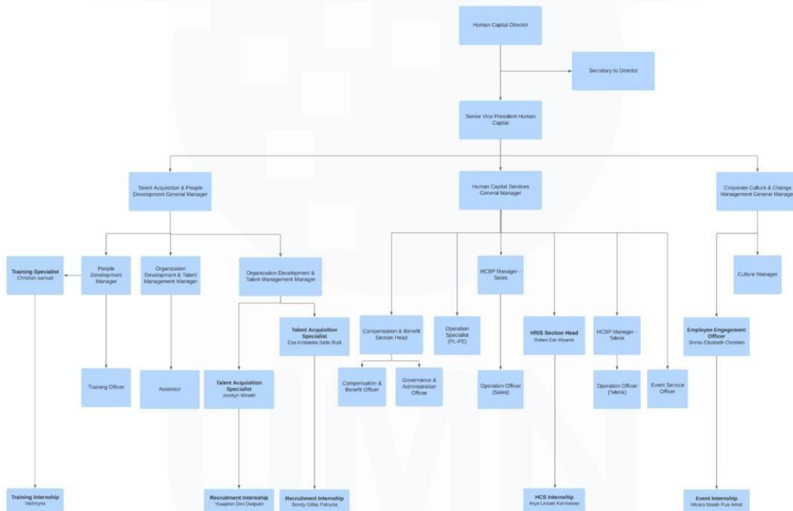
Gambar 2. 6

Struktur Organisasi Direktorat Human Capital di PT. Paramount Enterprise International