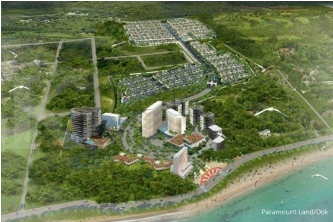
Gambar 2. 5 Proyek Residential & Commercial Di Manado (Paramount Hills Manado)

Tidak hanya di Semarang, dan di Curug, Perusahaan ini juga membangun infrastruktur residensial dan komersil di Manado dibawah Paramount Hills yang berlokasi strategis di pinggir Pantai Malalayang dan dekat dengan pusat kota Manado. Lokasinya yang strategis ini tentunya membawakan pengalaman baru untuk tinggal dekat pantai, selain itu konsep infrastruktur ini juga mengusung konsep custom homes , dimana desain rumah disesuaikan dengan selera konsumen.