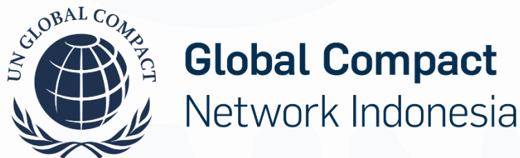
Gambar 2.1 Logo IGCN

Indonesia Global Compact Network (IGCN) merupakan jaringan lokal United Nations Global Compact di Indonesia. IGCN diluncurkan pada tanggal 8 April 2006 di Jakarta yang dihadiri oleh seluruh delegasi pada saat konferensi UNESCAP[7]. Sebanyak dua puluh dua perusahaan, organisasi bersama-sama membuat komitmen dan menandatangani komitmen untuk mendukung, mempromosikan, dan menerapkan prinsip-prinsip UN Global Compact. Terdapat empat pilar dari prinsip UN Global Compact, yaitu Human Right, Labour Standars, Environment, dan Anti-Corruption[8].