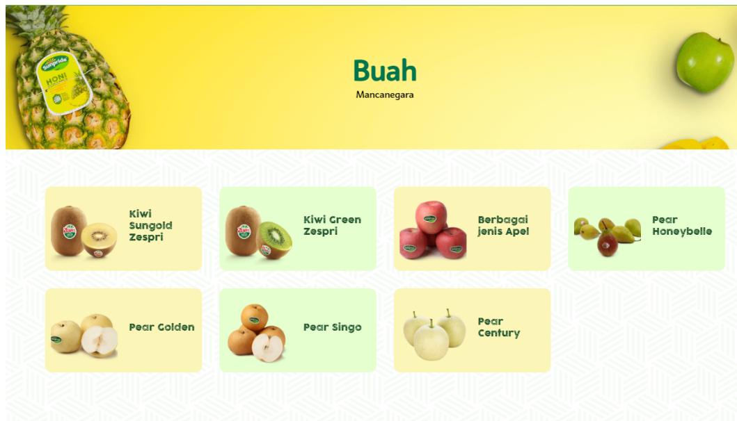
Gambar 2.2. Produk buah nusantara PT Sewu Segar Nusantara (Sunpride Indoensia)

PT Sewu Segar Nusantara (Sunpride Indoensia) juga merupakan salah satu distributor resmi ditunjuk oleh berbagai merek buah internasional salah satunya Zespri International Limited – New Zealand ,untuk buah kiwi green dan sungold juga berbagai jenis apel serta Pear Honeybelle. Selain itu mendistribusikan berbagai jenis buah pir seperti Pear Golden, Pear Singo dan Pear Century serta Apel Fuji (premium) yang berasal dari china. [13]