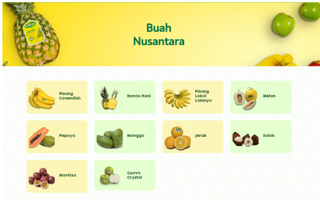
Gambar 2.1. Produk buah nusantara PT Sewu Segar Nusantara ( Sunpride Indoensia)

Produk buah nusantara merupakan produk buah berkualitas yang berasal dari perkebunan lokal di Indonesia, produk buah nusantara berfokus pada distribusi dan pemasaran buah lokal yang bekerja sama dengan PT Great Giant Pineapple untuk menghasilkan beberapa buah lokal yang ditanam di daerah Lampung di atas lahan lebih dari 3,500 hektar. Produk buah tersebut antara lain Pisang Cavendish, Guava Crystal, Nanas Honi, dan berbagai jenis Pepaya seperti Pepaya California dan Pepaya Callina. Selain itu juga PT Sewu Segar Nusantara bekerja sama dengan petani lokal menghasilkan Golden Melon, dan Rock Melon di Jawa Barat, Jeruk Baby, dan Jeruk Keprok di Jawa Timur, dan Jeruk Medan, Pisang Barangan dan Jeruk gerga di Sumatera. [13]