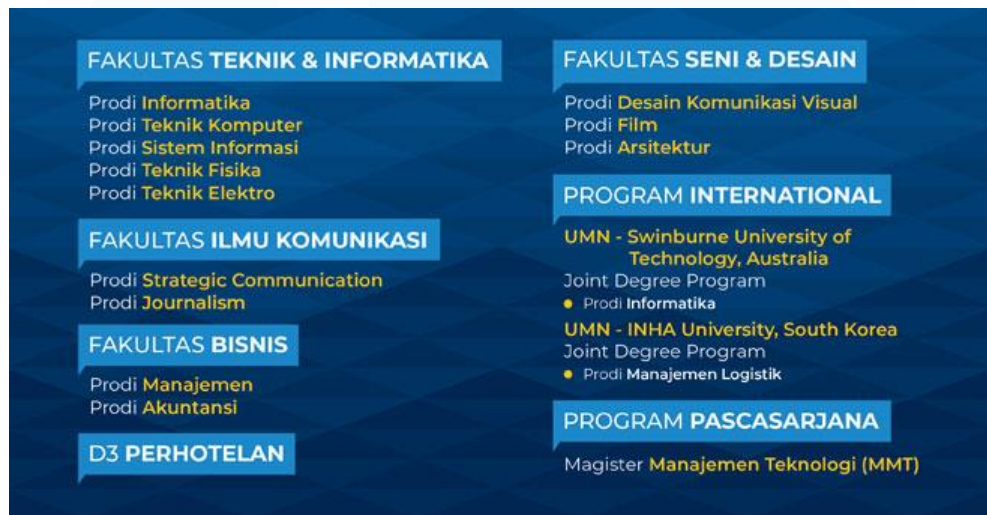
Gambar 2.3 Fakultas Universitas Multimedia Nusantara

modern. UMN juga telah mendapatkan pengakuan dan akreditasi dari berbagai lembaga dan badan akreditasi di Indonesia yaitu, UMN memiliki akreditasi A untuk institusi pendidikan. Hal tersebut tertuang dalam SK BAN PT No. 1068/SK/BAN-PT/Ak-PPJ/PT/XII/2021.