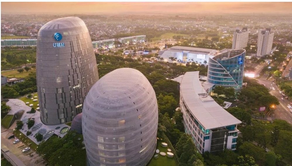
Gambar 2.2 Gedung Universitas Multimedia Nusantara

Pada mulanya, UMN didirikan dengan nama Sekolah Tinggi Manajemen Industri dan Desain (STIMID). Selanjutnya pada tahun 2006 STIMID merubah namanya menjadi Sekolah Tinggi Ilmu Komputer dan Manajemen Informatika (STIKOM) dan memperluas program studi yang ditawarkan dengan menambahkan bidang desain grafis, animasi, dan bisnis. Selanjutnya setelah pada tahun 2011, STIKOM merubah namanya untuk yang terakhir kali menjadi Universitas Multimedia Nusantara. Perubahan nama ini menunjukkan fokus Universitas Multimedia Nusantara dibidang multimedia dan industri kreatif serta komitmen yang kuat untuk menghasilkan lulusan yang bersaing di sektor ini.