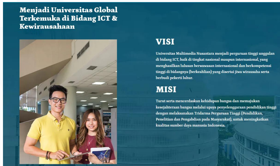
Gambar 2.4 Visi dan Misi Unversitas Multimedia Nusantar

Pada gambar 2.4 adalah visi dan Misi dari Unversitas Multimedia Nusantara. Visi dari Universitas Multimedia Nusantara itu sendiri yaitu menjadi perguruan tinggi unggulan di bidang ICT, baik di tingkat nasional maupun internasional yang menghasilkan lulus berwawasan internasional dan berkompentensi tinggi di bidangnya disertai jiwa wirausaha serta berbudi pekerti luhur.