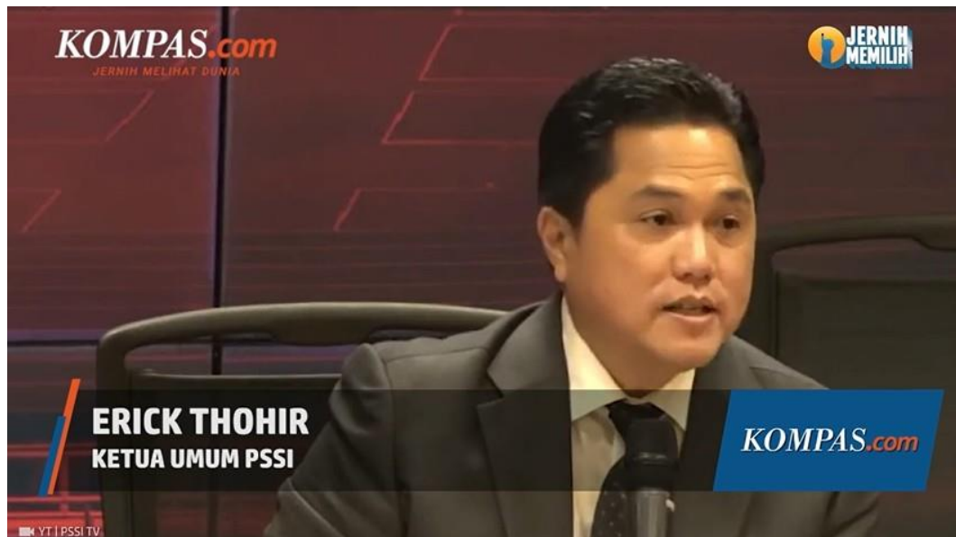
Gambar 3.2.2.2 Lower Third

Setelah selesai melakukan online dan offline editing , selanjutnya menjadikan hasil edit tersebut menjadi suatu kesatuan video. Tahap ini dinamakan exporting video yang memiliki standar untuk dapat ditayangkan melalui platform Youtube . Beberapa hal yang harus diperhatikan pada tahap exporting adalah besar ukuran data dari suatu video, ukuran kualitas video, frame per second , jumlah bit atau bitrate , dan bentuk format video. Setelah selesai melakukan tahap exporting selanjutnya melakukan tahap uploading dan dikirim kepada Produser untuk di- preview . Setelah melakukan preview , Produser akan memutuskan video tersebut untuk di- upload dalam platform Youtube di channel Kompas.com.