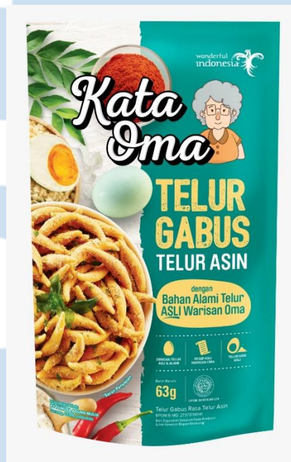
Gambar 2. 6 Kata Oma Telur Gabus Telur Asin

Kata Oma varian Telur Asin memiliki rasa gurih yang berasal dari bubuk telur asin asli. Varian Telur Asin terinspirasi oleh telur asin dari Brebes, Jawa Tengah, dengan campuran bumbu khas Indonesia. Adapun manfaat dari Telur Asin bagi kesehatan tubuh manusia yaitu dapat memperlancar peredaran darah, dapat mendukung pertumbuhan serta memperkuat tulang karena mengandung protein, vitamin D, dan mineral didalamnya.