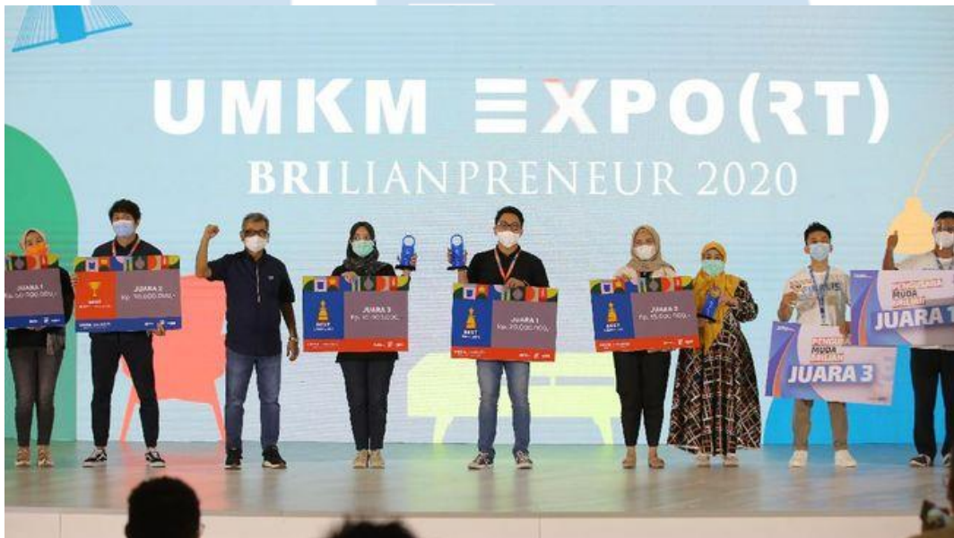
Gambar 2. 8 Pencapaian Kata Oma Best UMKM Brilianpreneur 2020

Akhir tahun 2020, Kata Oma berhasil meraih penghargaan “ Best UMKM ” dengan mencatatkan transaksi penjualan tertinggi di antara puluhan ribu UMKM lainnya, yaitu dengan total transaksi terjual 24.653 bungkus, dalam ajang pameran Industri Kreatif & UMKM ‘ Brilianpreneur 2020 ’ yang diselenggarakan oleh Bank BRI.