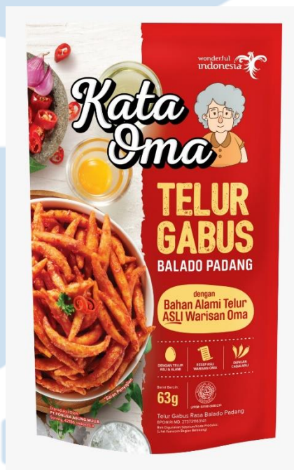
Gambar 2. 7 Kata Oma Telur Gabus Balado Padang

Kata Oma Balado Padang memiliki rasa pedas serta manis asli dari cabai balado padang asal Padang. Perpaduan bumbu balado khas Minang dipadukan dengan rasa pedas dari cabai asli menghadirkan sensasi unik pedas manis asin yang sangat digemari konsumen yang pecinta pedas. Melihat bahwa masyarakat Indonesia memiliki minat masakan pedas yang tinggi, maka Kata Oma mengeluarkan varian Balado Padang yang tingkat kepedasannya disesuaikan dengan masyarakat Indonesia. Masakan pedas tentunya juga terdapat manfaat bagi kesehatan, seperti meningkatkan metabolisme tubuh karena cabai mengandung capsaicin yang membantu tubuh dalam membakar kalori lebih cepat, dapat meningkatkan imun tubuh, melancarkan sirkulasi darah, dan lain sebagainya. Kata Oma Balado Padang tentu aman untuk dikonsumsi bagi seluruh anggota keluarga karena tanpa pengawet, tanpa MSG, dan gluten free .