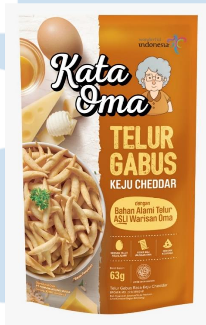
Gambar 2. 5 Kata Oma Telur Gabus Keju Cheddar

Kata Oma varian Keju Cheddar merupakan salah satu produk camilan tradisional favorit nomor 1 di Alfamart berdasarkan product performance 2023. Varian Keju Cheddar memiliki rasa gurih yang berasal dari keju cheddar Inggris asli yang mana cocok untuk pecinta asin, dengan teksturnya yang padat namun sekaligus renyah juga bisa dinikmati sebagai topping makanan berat seperti bakso, nasi goreng, ataupun soto. Kata Oma varian Keju Cheddar menggunakan bahan alami dari telur asli tanpa pengawet, gluten free dan tanpa MSG . Keju sendiri memiliki beragam manfaat bagi tubuh manusia, karena tinggi kalsium serta memiliki banyak nutrisi dan vitamin seperti karbohidrat, lemak, protein, zinc, magnesium, vitamin A, vitamin D, dan vitamin K.