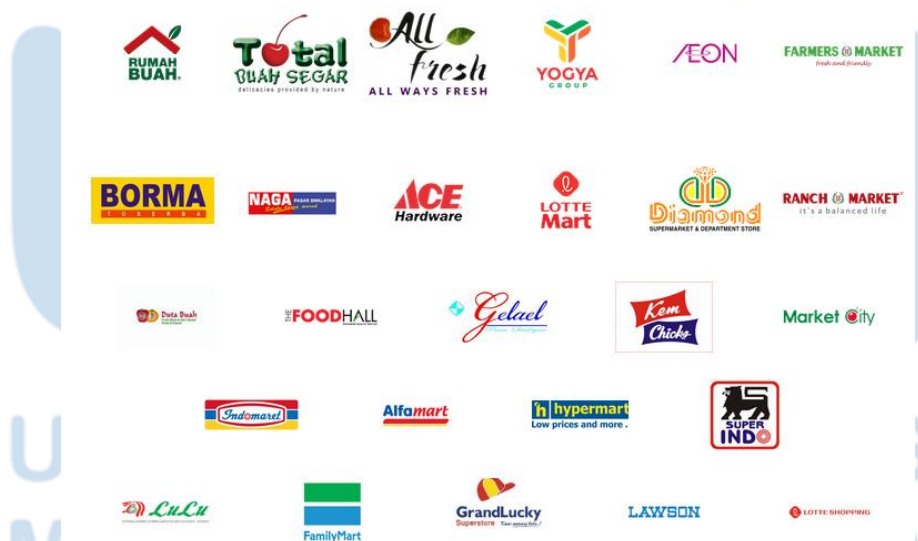
Gambar 2. 1 Toko offline produk Kata Oma Telur Gabus

Produk Kata Oma bisa didapatkan secara offline di tempat-tempat berikut :