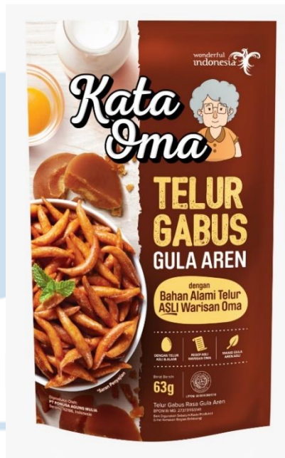
Gambar 2. 4 Kata Oma Telur Gabus Gula Aren

Kandungan dari gula aren sendiri memiliki banyak manfaat yang baik bagi tubuh manusia, diantara lain yaitu dapat membantu mengembalikan energi tubuh, menjaga kadar gula darah, meningkatkan imun tubuh, menjaga kesehatan tulang, dan lain sebagainya. Selain itu, gula aren juga memiliki indeks glikemik yang lebih rendah, terlebih Kata Oma varian gula aren dibuat menggunakan gula aren asli tanpa adanya tambahan gula lain, gula kimia, ataupun pemanis buatan lainnya, sehingga aman dikonsumsi bagi penderita diabetes.