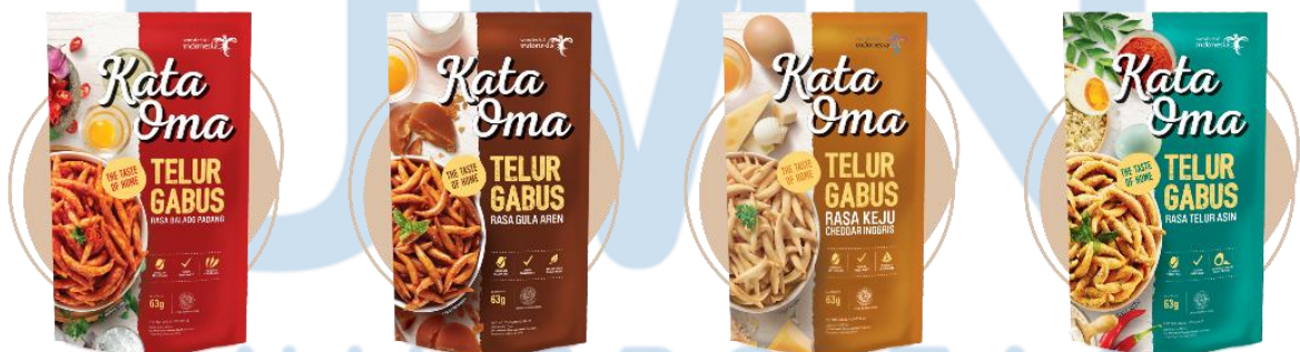
Gambar 2. 3 Varian Produk Kata Oma Telur Gabus

Selain itu Kata Oma memiliki lambang Wonderful Indonesia yang artinya telah disahkan oleh departemen Kementerian Pariwisata Indonesia sebagai camilan tradisional khas Indonesia dan bersama – sama dengan departemen pariwisata memperkenalkan Telur Gabus sebagai Camilan Asli Indonesia ke dunia. Telur Gabus yang diproduksi oleh Kata Oma dibuat dengan quality control yang ketat sehingga dalam pembuatannya dapat terjamin higienis. Produk Telur Gabus Kata Oma memiliki 4 varian yang berbeda yaitu sebagai berikut :