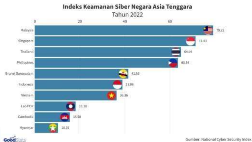
Gambar 1.1 Indeks Keamanan Siber di Asia Tenggara

Salah satu bagian penting yang ada pada Perusahaan pada era modern merupakan sistem operasional, aset, data keamanan serta jaringan. Dengan adanya Security Analyst , perusahaan dapat menjaga keberlanjutan operasional, melindungi aset informasi yang berharga, meminimalkan risiko serangan, dan memenuhi persyaratan keamanan dan regulasi yang berlaku