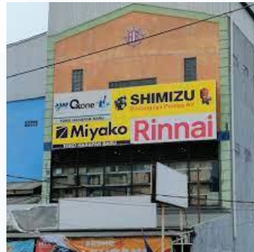
Gambar 2.1. Logo toko dan tampilan toko dari luar

Toko Harapan Baru merupakan toko yang telah berdiri sejak tahun 2002. Nama toko Harapan Baru memiliki arti bahwa toko tersebut akan memberikan harapan yang selalu baru kepada semua orang yang berbelanja termasuk kepada ownernya dengan penyediaan barang yang lengkap dan juga pelayanan yang ramah. Sejak zaman dahulu hingga sekarang, toko Harapan Baru menjual berbagai jenis alat-alat kebutuhan rumah tangga seperti kompor, kipas angin, piring, gelas, dan masih banyak lagi lainnya. Toko Harapan Baru menjual barang-barang perabotan rumah tangga karena mereka paham bahwa barang-barang tersebut merupakan barang-barang yang menjadi kebutuhan dasar bagi setiap rumah tangga di Indonesia. Toko Harapan Baru menjual barang-barang perabotan dengan harga yang bersaing agar menarik minat banyak pembeli.