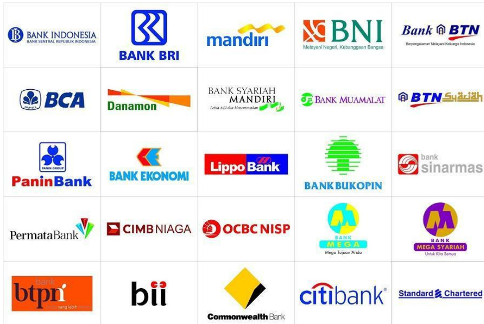
Gambar 1.1. Kumpulan Bank terbaik di Indonesia

Bank (XXXX) merupakan salah satu bank yang termasuk pada Bank swasta yang ada di Indonesia. Bank (XXXX) termasuk kedalam kategori KBMI (Kumpulan Bank Modal Inti) 3 dengan modal inti yang berada di kisaran Rp 14 triliun - Rp 70 triliun, didalamnya terdapat PT. Bank (XXXX) Tbk, PT. Bank Tabungan Negara (Persero) Tbk, PT Bank BNP Paribas Indonesia, PT Bank Danamon Indonesia Tbk, PT Bank Syariah Indonesia Tbk, PT Bank Mega Tbk, PT Bank OCBC NISP Tbk, PT Bank Permata Tbk, PT Bank UOB Indonesia, dan PT Bank Maybank Indonesia Tbk. Dan pada kategori sebelumnya Bank (XXXX) termasuk kedalam kategori BUKU (Bank Umum Kegiatan Usaha) 4 dengan modal inti lebih dari Rp 30 triliun, didalamnya terdapat PT. Bank (XXXX) Tbk, PT Bank Rakyat Indonesia (Persero) Tbk, PT Bank Central Asia Tbk, PT Bank Mandiri (Persero) Tbk, PT Bank Negara Indonesia (Persero), PT Bank Pan Indonesia Tbk,