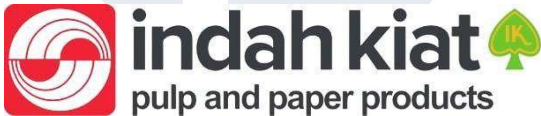
Gambar 2.1 Logo Perusahaan PT. Indah Kiat Pulp & Paper Tbk

PT. Indah Kiat Pulp & Paper Tbk merupakan perusahaan yang bergerak di bidang produksi pulp , kertas budaya, kertas industri dan tisu. PT. Indah Kiat Pulp & Paper mengawali kegiatan usahanya dengan memanfaatkan pengolahan kayu menjadi pulp dan kertas serta pemanfaatan kertas bekas menjadi kertas industri. Bidang usaha PT Indah Kiat Tbk meliputi industri, perdagangan dan kehutanan. Saat ini Indah Kiat memproduksi pulp , aneka produk kertas yang terdiri dari kertas tulis dan kertas cetak, kertas fotokopi, kertas industri seperti kertas kemasan yang juga termasuk container board ( liner board dan media bergelombang), container pengiriman bergelombang (konversi dan media bergelombang), packaging makanan, karton dan kertas berwarna ( Website IKPP, 2019 ).