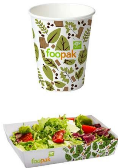
Gambar 2.4 Produk Foopak Bio Natura Asia Pulp & Paper

Selain produk kertas dan tisu, Asia Pulp & Paper berinovasi meluncurkan produk kemasan bernama Foopak Bio Natura. Foopak Bio Natura sendiri merupakan hasil rancangan atas solusi kemasan makanan dan minuman yang bersifat ramah lingkungan, menggunakan teknologi pelapis dispersi di bagian paling depan untuk menggantikan lapisan plastik dalam industri jasa makanan. Foopak Bio Natura menggunakan bahan-bahan berkualitas dalam penyusunannya seperti sumber kayu bersertifikat, bebas OBA, tahan terhadap suhu tinggi, dan sumbu tepi yang tahan akan air. Hal-hal tersebut yang membuat Foopak Bio Natura lebih unggul dibandingkan produk kemasan lain. Foopak Bio Natura sendiri dapat dikomposkan dalam waktu 12 minggu di fasilitas kompos industri dan 26 minggu dalam pembuatan kompos rumah. Foopak Bio Natura juga dapat didaur ulang dan dapat di re-pulp tanpa memerlukan proses lanjutan.