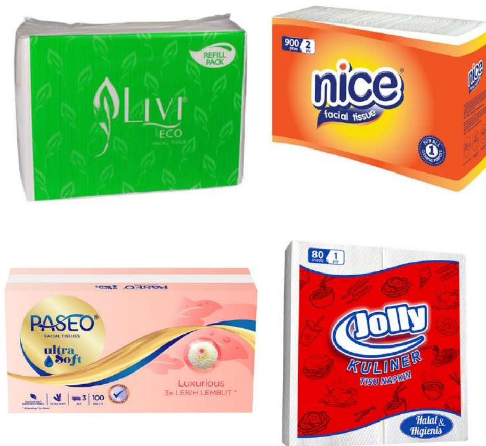
Gambar 2.3 Produk Tisu Asia Pulp & Paper

Selain kertas, produk-produk Asia Pulp & Paper yang sudah tersebar luas di masyarakat adalah produk tisu seperti Paseo, Nice, dan Livi. Dimana, produk tersebut mudah ditemukan di pasaran dan tentunya dengan harga yang cukup terjangkau. Asia Pulp & Paper menghasilkan produk-produk tisu tersebut tentunya dengan memaksimalkan kualitas yang baik, nyaman di kulit, serta memiliki tingkat ketebalan dan kelembutan yang pas.