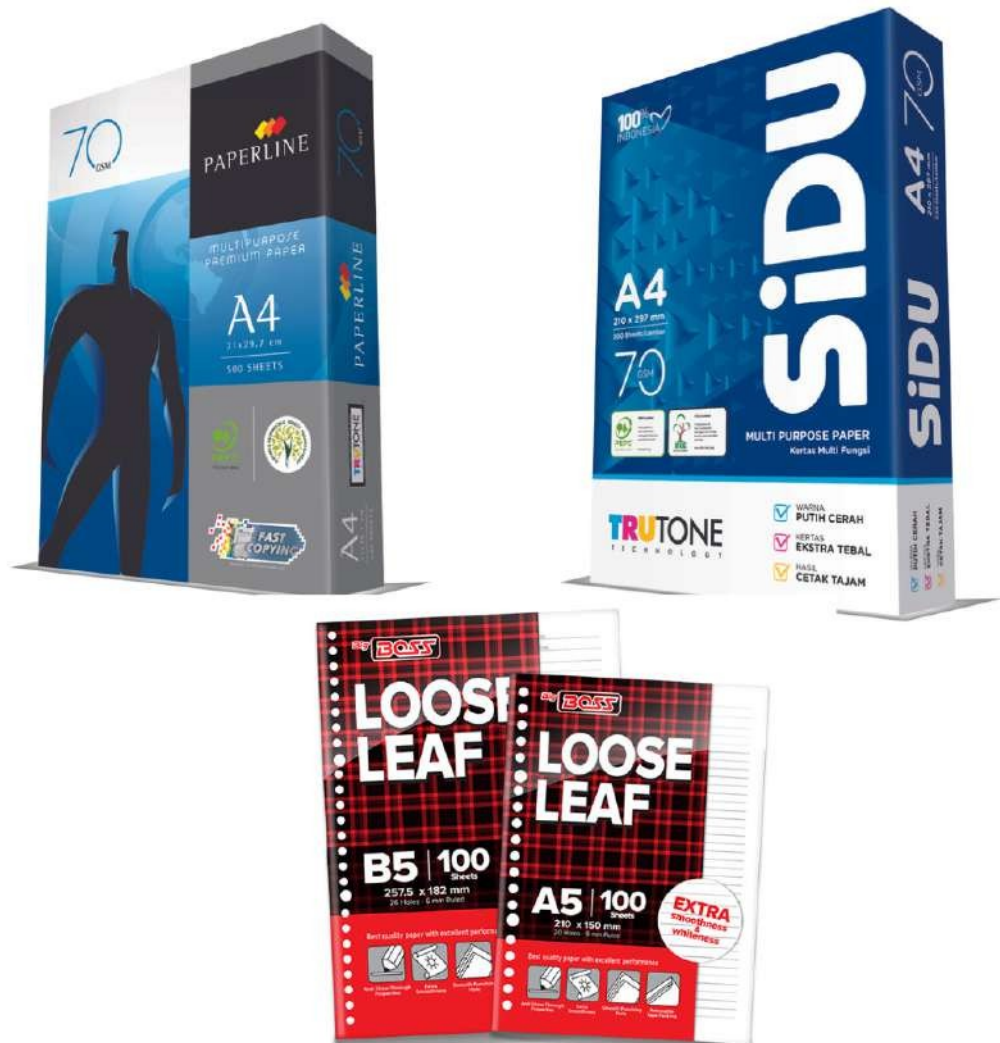
Gambar 2.2 Produk Kertas Asia Pulp & Paper

merek kertas yang diproduksi oleh perusahaan-perusahaan yang dinaungi oleh Asia Pulp & Paper.