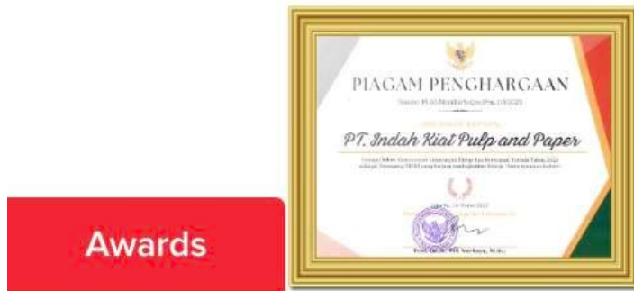
Gambar 2.6 Penghargaan Mitra KLHK (Kementerian Lingkungan Hidup dan Kehutanan) Terbaik 2023