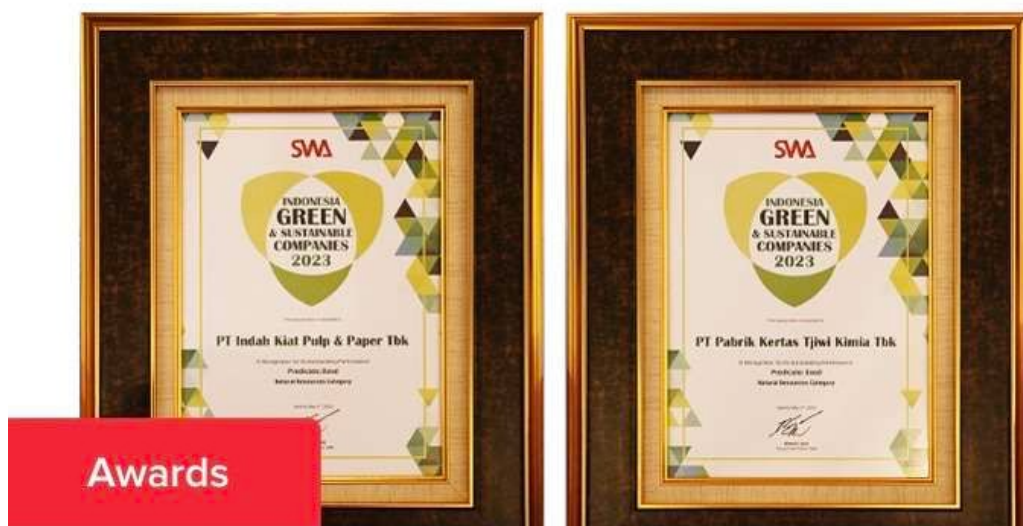
Gambar 2.5 Penghargaan Indonesia Green & Sustainable Companies Award (ISGCA) 2023

Dengan berbagai produk Asia Pulp & Paper yang sudah terdistribusikan dengan baik di seluruh masyarakat, perusahaan mendapatkan beberapa pencapaian terkait sistem perusahaan yang baik serta produk-produk inovatif yang sukses di pasaran. Penulis memasukkan 2 penghargaan yaitu Penghargaan Indonesia Green & Sustainable Companies Award (ISGCA) 2023 dan Penghargaan Mitra KLHK Terbaik 2023 yang berhasil diraih oleh PT. Indah Kiat Pulp & Paper dibawah naungan Asia Pulp & Paper.