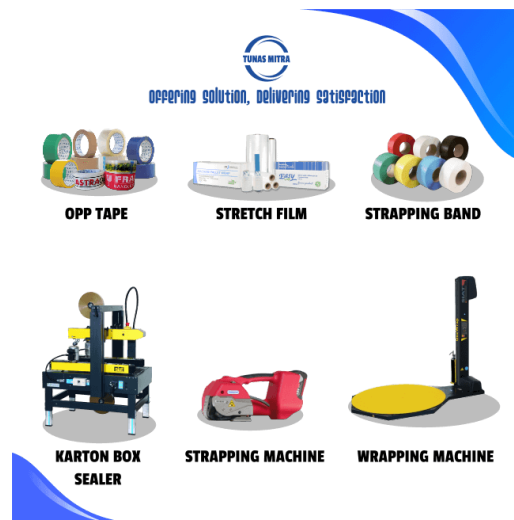
Gambar 2.1 Produk Tunas Mitra

Tunas Mitra adalah perusahaan dengan penyedia kebutuhan kemasan yang sudah berdiri sejak tahun 1999 dengan nama PT. Tunas Mitra Jaya di Batam, dan pada saat 2009 Tunas Mitra memiliki nama awal TM Supply. Dalam berjalannya waktu, TM Supply terus berkembang dan telah berkembang menjadi suatu perusahaan yang memiliki cabang di beberapa kota besar di Indonesia. Pada saat tahun 2009, Tunas Mitra membuka perusahaan dengan nama PT. Tunas Mitra Sukses di Bekasi, pada saat tahun 2016, Tunas Mitra membuka cabang di Semarang dengan nama PT. Tunas Mitra Sentosa, pada tahun 2016, Tunas Mitra juga membuka cabang di Tangerang dengan nama PT. Tunas Mitra Makmur, pada tahun 2021, Tunas mitra membuka cabang di Surabaya dengan nama PT. Tunas Mitra Maju. Tunas Mitra menyediakan bermacam-macam kebutuhan kemasan seperti OPP Tape, Stretch Film, Strapping Band, Packaging Machine, dan berbagai material kemasan pendukung lainnya.