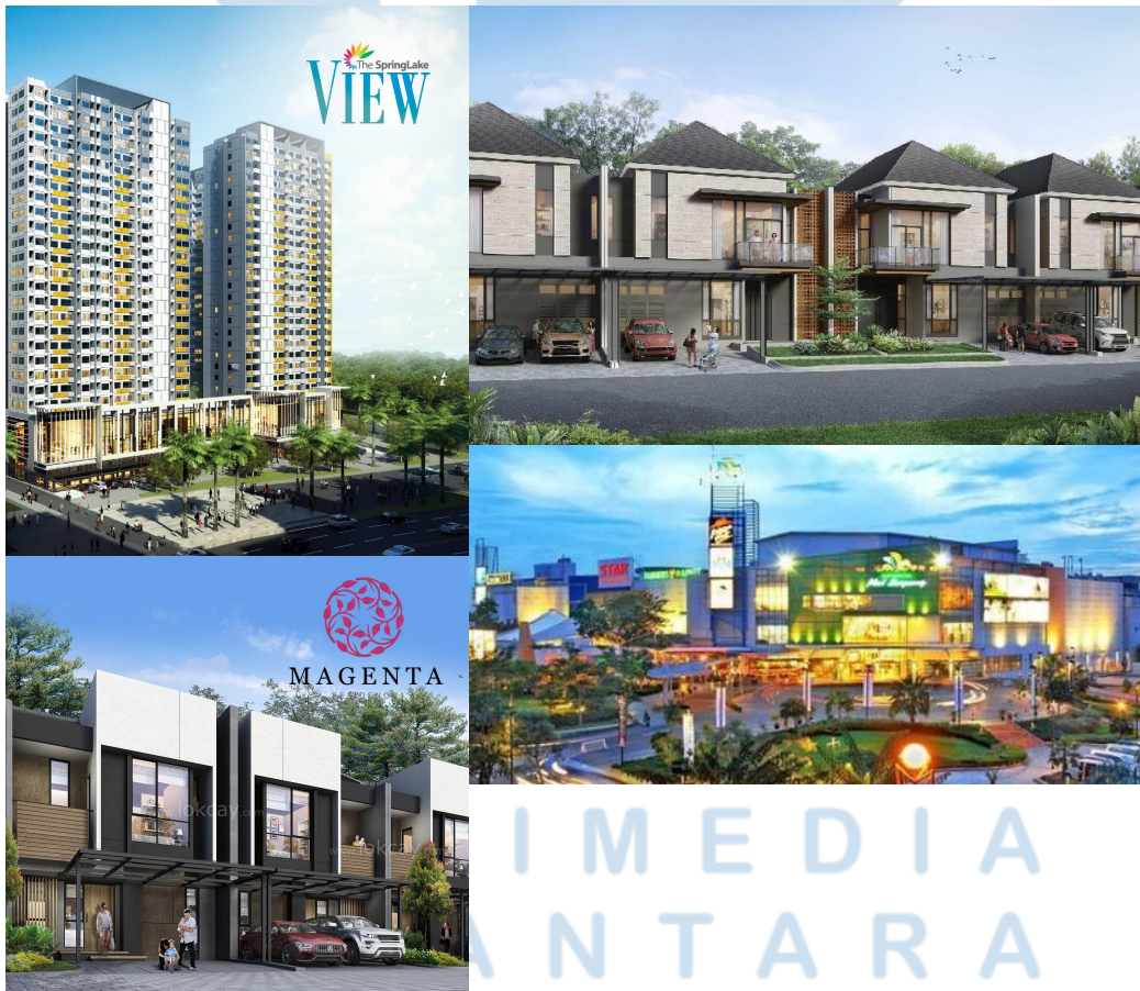
Gambar 2.2 Beberapa Hasil Properti Summarecon

Pada bulan September 1976, perusahaan ini mulai mengembangkan perumahan di atas lahan seluas 10 hektar di Kelapa Gading Permai (kini Summarecon Kelapa Gading) dan mendirikan ruko di sepanjang Jl. Bulevar Kelapa Gading. Pada bulan Mei 1984, perusahaan ini membuka Kelapa Gading Permai Sports Club (kini Klub Kelapa Gading), lalu pada tahun 1987, perusahaan ini mulai membangun perumahan Bukit Gading Villa. Selanjutnya pada Maret 1990, perusahaan ini membuka Mal Kelapa Gading fase 1, dan pada tanggal 7 Mei 1990, perusahaan ini resmi melantai di Bursa Efek Jakarta dan Bursa Efek Surabaya. Perusahaan ini juga melakukan joint venture dengan Grup Batik Keris pada Maret 1991 untuk mengembangkan Gading Serpong di atas lahan seluas 1.500 hektar di Tangerang. Sampai sekarang PT Summarecon Agung Tbk (SMRA) masih terus melakukan pembangunan real estate (apartemen dan kompleks rumah), pusat perbelanjaan, fasilitas perkantoran, fasilitas olahraga, dan restoran beserta sarana penunjangnya.