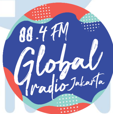
Gambar 2.2 Logo Global Radio

Global Radio, sebelumnya Radio ARH atau Arief Rachman Hakim yang berdiri sejak tahun 60an, lebih tepatnya 1 Oktober, penamaan ini mengambil dari nama seorang aktivis yaitu Arief Rahman Hakim. Radio ARH mengubah segmen musik dan target audiensnya di tahun 90-an menjadi officer (Pegawai Muda) dengan sapaan “ Officer Jakarta”. Aliran musik yang berbeda dari pop, rock, R&B, dan jazz kecuali Dangdut dan berlokasi di RCTI-Kebon Jeruk, Jakarta Barat. Di frekuensi baru 88,6 FM dengan segmen "Station For The Future, Never Stop Learning" Global Radio Jakarta mulai mengudara sejak 2005 dengan sasaran audiens berumur 25 hingga 35 tahun. Pada tahun tersebut, radio ini beralih format ke Hot AC dan diakuisisi oleh MNC Media Group.