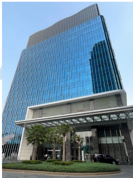
Gambar 2.3 Gedung Perusahaan