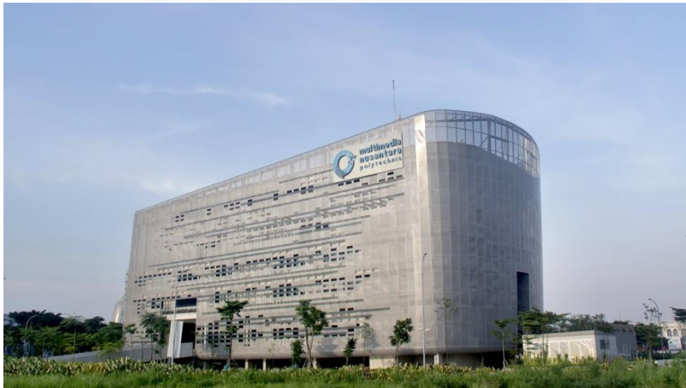
Gambar 2.2 Gedung Multimedia Nusantara Polytechnic [9]

terus berinovasi dalam mencerahkan generasi penerus bangsa ( enlightening people ) melalui pendidikan vokasi yang unggul berbasis Information Communication Technology (ICT) dengan nilai-nilai 5C, yakni Caring, Credible, Competent, Competitive, dan Customer Delight (Experience) .