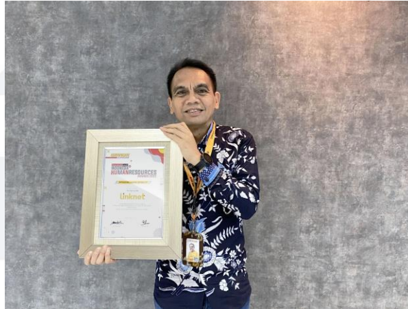
Gambar 1.3 HR Awards 2023

Tidak hanya itu, direktorat Human Capital Link Net sering memenangkan penghargaan Indonesia Human Resource Awards lainnya yaitu The Best HR Management for The Outstanding Excellent Strategies, Values, and Digital Programs to Develop Competent HR pada tahun 2021, meraih sertifikat Great Place To Work pada tahun 2022, dan berada pada posisi kedua untuk The Best Indonesia Human Capital 2021 dengan predikat Platinum A Very Excellence . Hal tersebut tentunya dicapai akibat kinerja dan kerja keras bersama seluruh karyawan direktorat Human Capital PT. Link Net Tbk, seperti melakukan training, coaching, dan special project dalam rangka mencapai peningkatan terhadap kompetensi diri dan self traits para karyawan melalui aplikasi Purposeful Experience sebagai program self learning yang difasilitasi oleh perusahaan dan penerapan evaluasi pencapaian dan kinerja yang dilakukan secara berkala setiap bulannya sebagai media komunikasi dan kolaborasi antar departemen Human Capital . PT. Link Net Tbk akan terus melaksanakan program dan kegiatan pengembangan upskilling maupun reskilling yang dapat