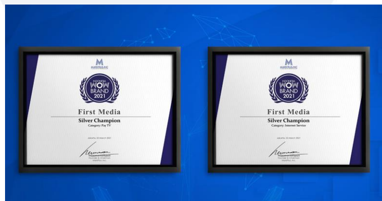
Gambar 1.2 WOW Brand Award 2021

sembari meningkatkan jumlah penggunanya melalui jangkauan yang luas dan kecepatan internet yang memuaskan kebutuhan konsumen. Atas kepedulian First Media akan kebutuhan dan permintaan konsumen, pada tahun 2021 First Media terpilih menjadi brand paling direkomendasikan oleh konsumen pada penghargaan Indonesia WOW Brand 2021 untuk kali keenamnya. Keberhasilan yang dicapai oleh First Media berasal dari dedikasi dan loyalitas para karyawan “ First Squad ” yang senantiasa menyediakan pelayanan terbaik demi menjaga kepuasan konsumen dan memperkenalkan First Media ke khalayak luas dengan terus mengikuti jejak kebutuhan konsumen dan pola konsumsi masyarakat dalam memenuhi kebutuhan internet agar dapat membantu masyarakat memiliki pengalaman yang maksimal dalam menggunakan layanan internet dari First Media.