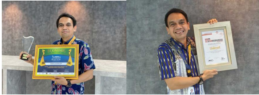
Gambar 1.4 HR Awards 2021 & 2022

menjamin karyawan sejahtera dan meningkatkan pertumbuhan bisnis.