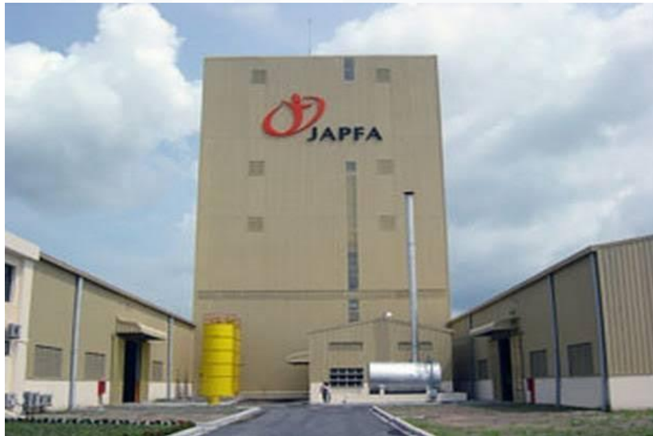
Gambar 2.1 Japfa Feedmill

bernama Tokusen Wagyu Beef, Santori beef dan lainnya. Setelah itu ada juga lini Aquaculture yang dikelola oleh anak perusahaan Japfa yang bernama PT Suri Tani Pemuka (STP) yang mengelola peternakan segala lini ternak air tawar seperti ikan lele, udang, ikan nila dan lainnya, produk-produk olahan juga diproduksi oleh STP.