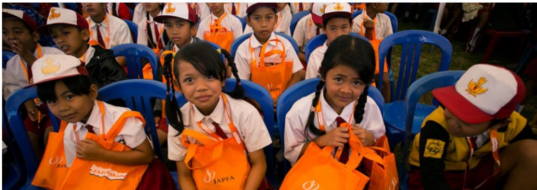
Gambar 2.2 Japfa for Kids