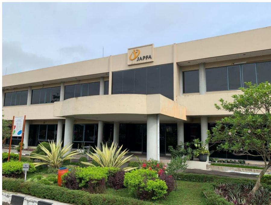
Gambar 2.3 Kantor Japfa Unit Lampung

PT Japfa Comfeed Indonesia Tbk - Unit Lampung berdiri pada tahun 1995 yang beralamat di Jl. Insinyur Sutami No.18, RW.2, Sukanegara, Kec. Tj. Bintang, Kabupaten Lampung Selatan.