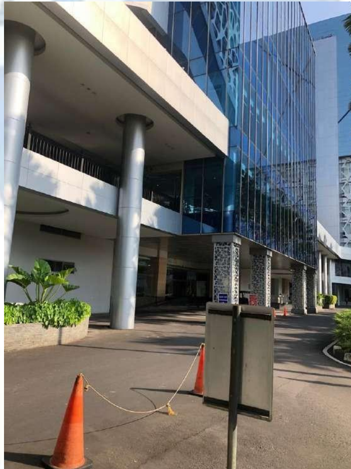
Gambar 2. 1 Perusahaan PT.MNC Media