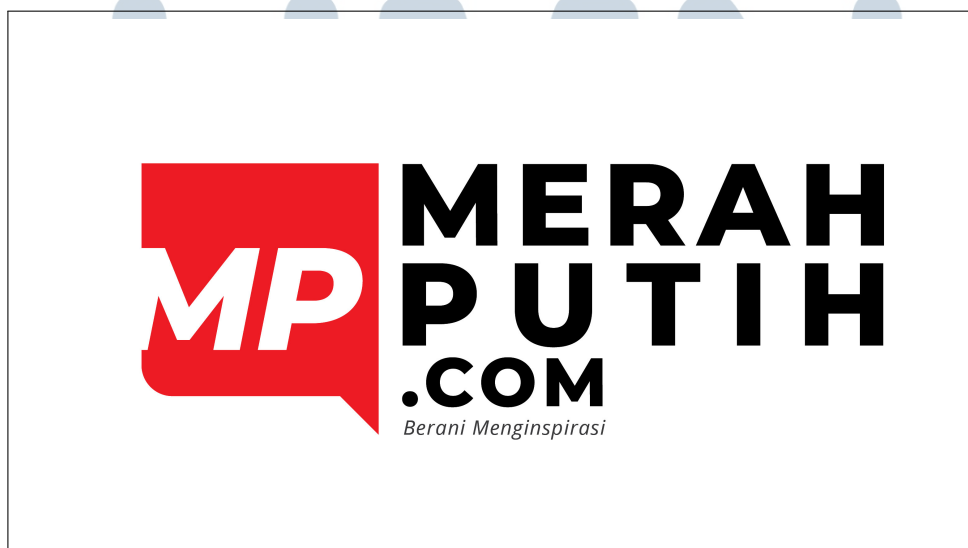
Gambar 2.1. Logo Perusahaan Merah Putih Media

MerahPutih.com adalah website yang menyediakan konten multimedia, baik hardnews maupun softnews atau feature . Dalam hal pelaporan berita serius, MerahPutih.com menawarkan saluran berita yang didedikasikan untuk Berita Indonesia, Berita Dunia, dan Berita Lainnya. Beberapa saluran di MerahPutih.com meliputi berita dan fitur yang lebih lembut, seperti Indonesiaku, Hiburan dan Gaya Hidup, Olahraga, dan Foto. MerahPutih.com tidak hanya memproduksi artikel dan konten tulisan lainnya, tetapi juga video dan foto yang dibagikan di platform media sosial seperti YouTube dan Instagram.