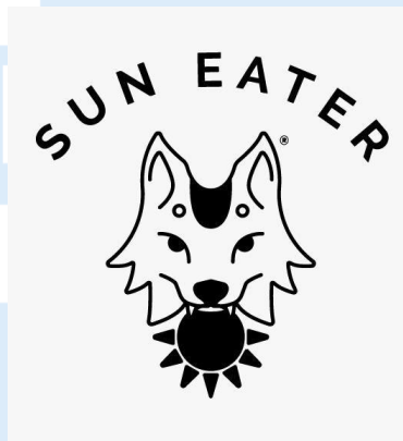
Gambar 2.1 Logo Sun Eater Coven