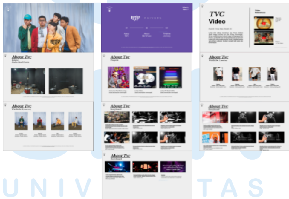
Gambar 3. 3 Creative Deck Faivers X Lomba Sihir

Dalam tahap pre-production penulis ditugaskan untuk membuat deck yang dimana deck tersebut berisi beberapa detail dan material yang dibutuhkan untuk proyek yang akan dikerjakan. Dalam tahap pertama pre-production penulis mengerjakan deck bersama manajer musisi yang nantinya akan di dipresentasikan kepada musisi. pengerjaan deck pada umumnya memakan waktu 2-4 hari yang dimana setiap deck terdiri dari referensi video atau foto, wardrobe , dan storyboard . tahap selanjutnya ketika penulis sudah mempresentasikan deck kepada musisi, penulis dan manajer musisi akan mulai mencari bahan dan menyiapkan equipment yang akan dipakai untuk proyek tersebut. Pada project ini dalam tahap pre-production penulis berperan membantu untuk menyiapkan equipment dan bahan untuk digunakan saat tahap production . Berikut adalah contoh pitch deck mengenai apa saja yang perlu disiapkan untuk project Faivers x Lomba sihir: