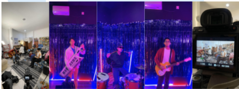
3.4 Behind the scene Lomba sihir x Faivers

Dalam tahap production pada proyek TVC Faivers x Lomba Sihir memakan waktu sekitar 1 hari yang berlokasi di Abuserin, Jakarta Selatan. penulis memiliki tanggung jawab sebagai Director dan DOP . Tugas penulis sebagai director adalah untuk merealisasikan ide yang sudah dibuat dalam proses pre-production sedangkan tugas penulis sebagai DOP adalah untuk merealisasikan ide menjadi visual yang sudah di tentukan oleh musisi dan manajer sekaligus menambahkan ide dari bayangan penulis. Selama menjalankan proses shooting semua berjalan dengan lancar hanya ada sedikit sekali kendala dengan lighting .